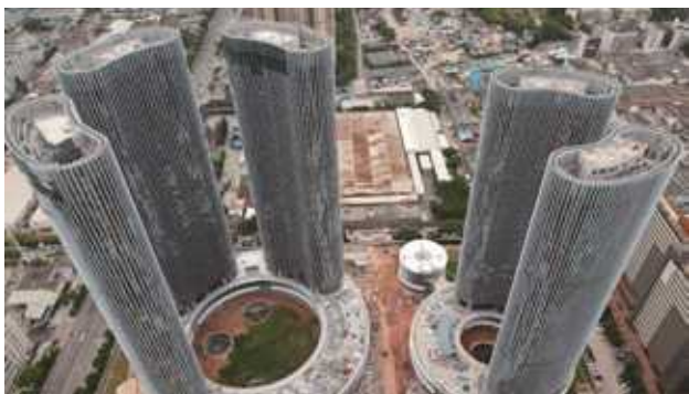
OPPO 长安研发中心项目