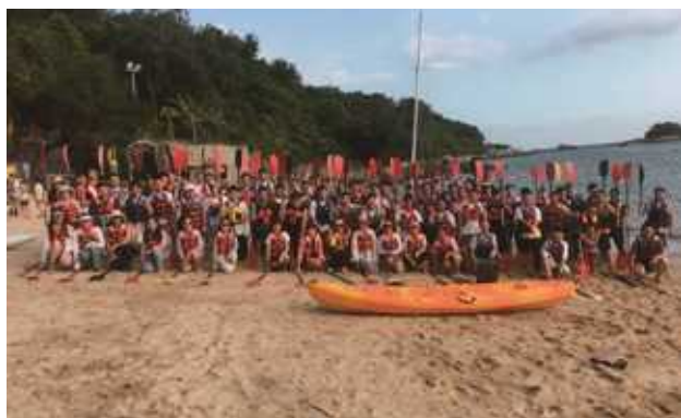
方大集团员工团建活动