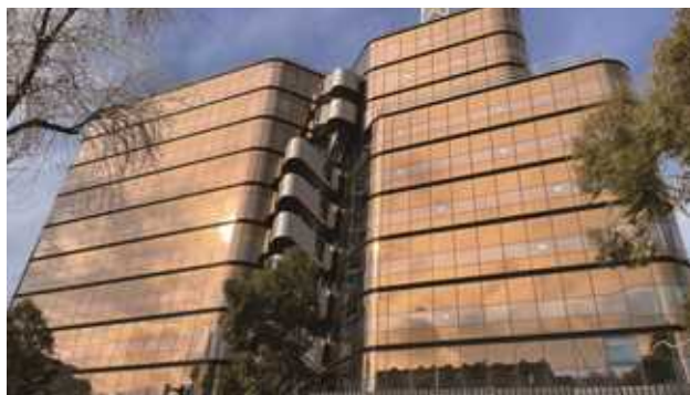
澳大利亚 Victoria Place

● 智慧幕墙及新材料产业中标签约 525,410.02 万元,较去年增长 8.60%, 订单储备达 684,083.75 万元。