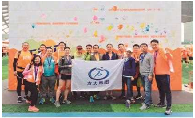
方大集团文体协会活动