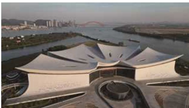
广州南沙国际金融论坛（IFF）永久会址项目