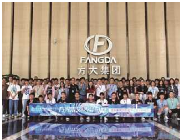
2023年新员工座谈会及员工培训现场